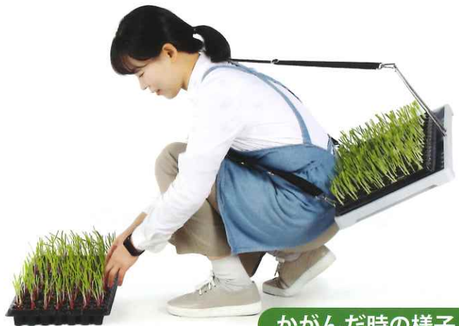
かがんだ時の様子