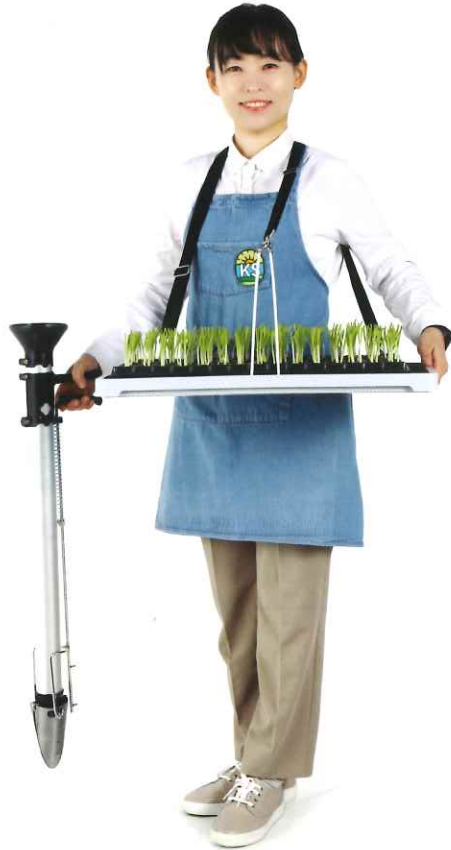
右手で苗移植機を使用する様子