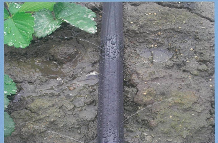
【強力P.E灌水チューブ規格】