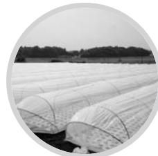
トンネル使用事例

トンネルにも使用可能。涼感ホワイトをトンネル用として採用した商品「ラウンドクール」もございます。