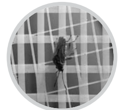
防虫事例 (ホワイト20で目合約0.6mm)