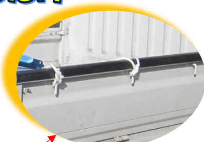
フックにロープを結んで固定

本体寸法 1400W × 800D × 280H(mm) 容量: 300ℓ 注水時間: 水道で約15分 (想定 20ℓ/分)