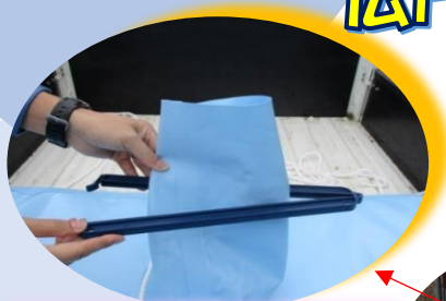
クリップで注水口を留める