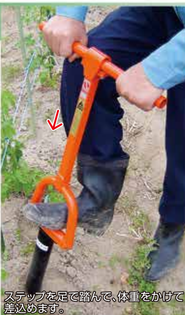
ステップを足で踏んで、体重をかけて