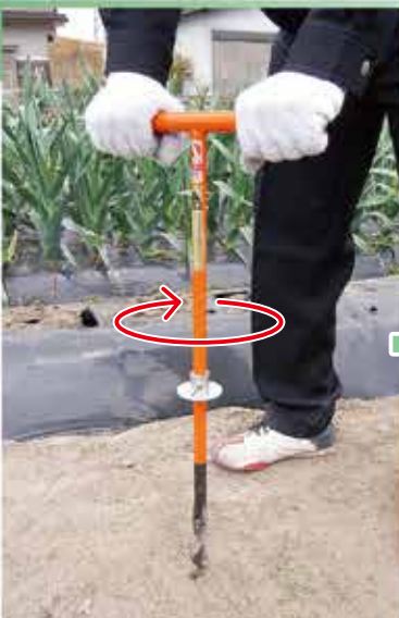
1 ストッパーをセットし、ハンドルを回して、土中にネジ込んでいきます。