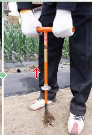
2 穴の深さがストッパーまで到達したら、本器を引上げます。