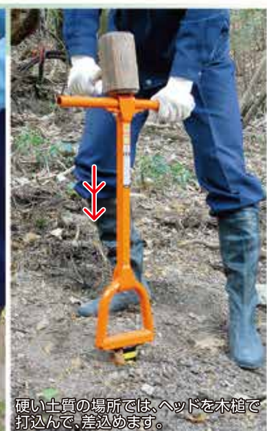
硬い土質の場所では、ヘッドを木槌で打込んで、差込みます。