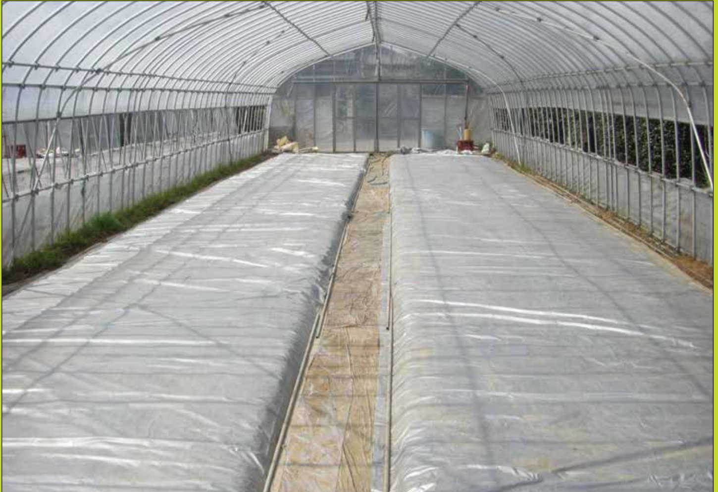
育苗箱にシルバーポリトウを直掛したハウス内の状態